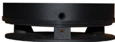
Montage mittels innenliegendem Bodenflansch

Schutzart: IP65 Schutzklasse: SK I Schutzleiteranschluss Schlagfestigkeit: IK08